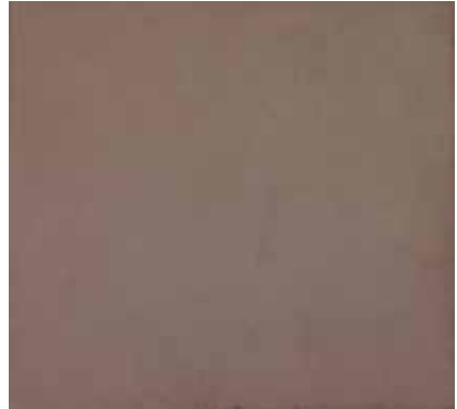
Lichaam (vallen), 2016, olieverf op doek, 55x60 cm