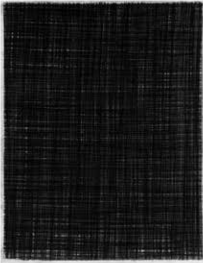
Arjan Janssen, 1995 Siberisch krijt op papier, 65x50 cm