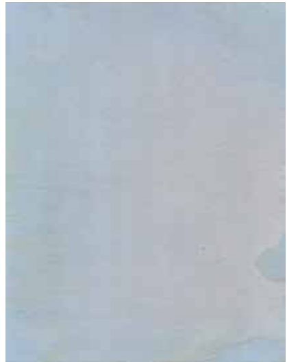
Lichaam (studie voor de ademhaling), 2016, olieverf op hout, 30×23,5 cm