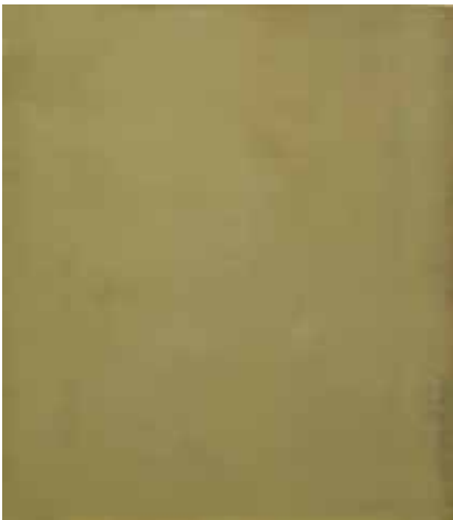
Memoria Paradou, 2016, olieverf op doek, 90x80 cm