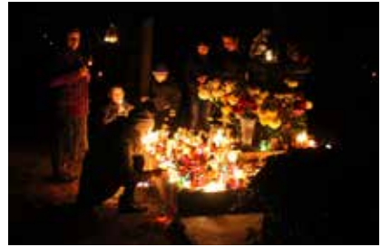
Allerzielen 2015 Beregszasz, Oekraïne

P.S. Denken is een vorm van handelen. De gedachte is een lichamelijke sensatie, een oplichtende en ijle vorm van materialisatie. Zoals dit schrijven.